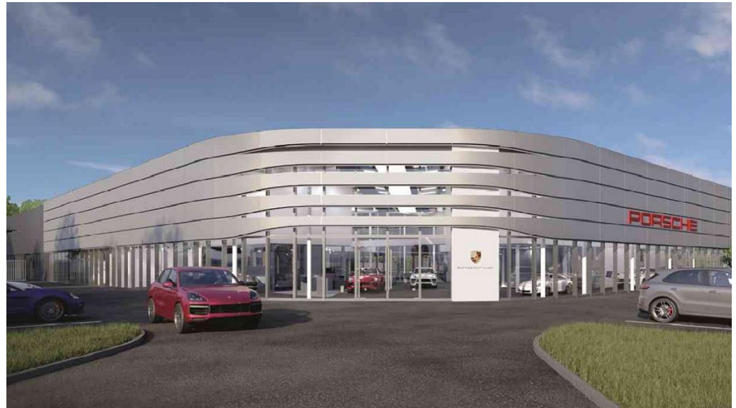
Foto Porsche https://www.autohaus.de/nachrichten/dinslaken-neues-porsche-zentrum-in-der-planung-2580515.html